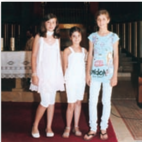
Guanyadores del Concurs de Redacció.