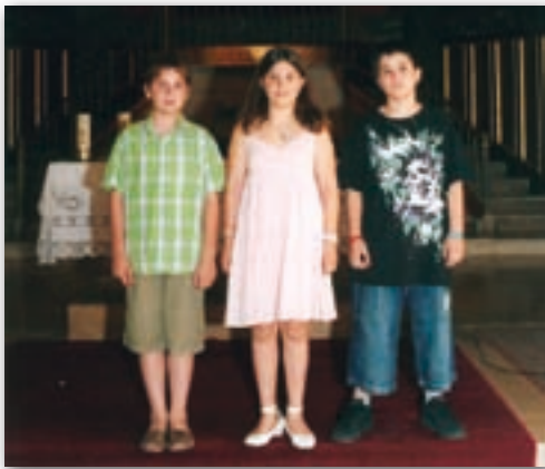
Guanyadors del Concurs de Dibuix.