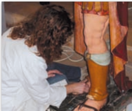
Netejant l'armat de la llança.

En aquells moments la Germandat de Sant Pere Apòstol tenia el seu pas Pere nega a Jesús, a l'Escola d'art de Tortosa, i ens van comentar que mantenien converses amb la Diputació i es podria arribar a un acord per que es poguessin arranjar