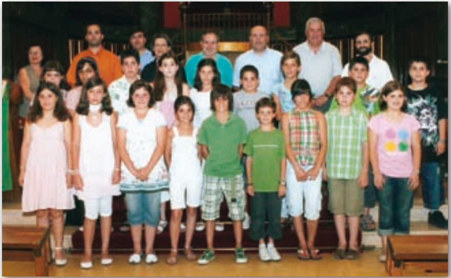
Participants al Novè Concurs de Redacció i Quart Concurs de Dibuix i Pintura