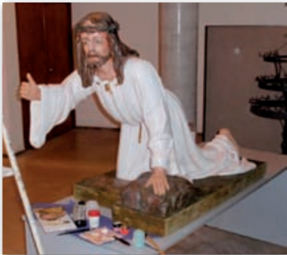
Imatge del Crist ja netejat i envernissat.

totes les figures escultòriques de la nostra ciutat que surten en processó i que és trobessin malmeses.