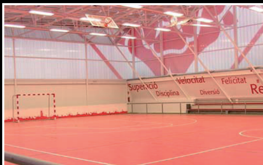
- PAVELLÓ CIUTAT DE REUS -