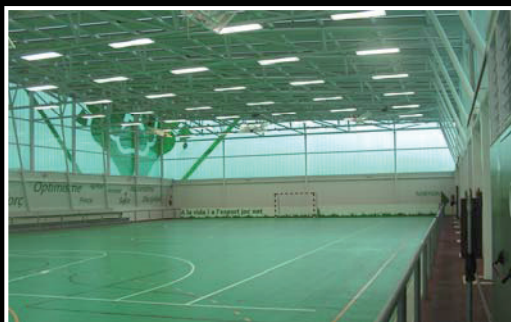
- PAVELLÓ ALBERICH I CASAS -

Gaudeix fent esport als POLILLEUGERS de la ciutat.